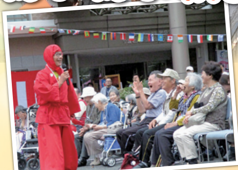
はっちゃん(大道芸)