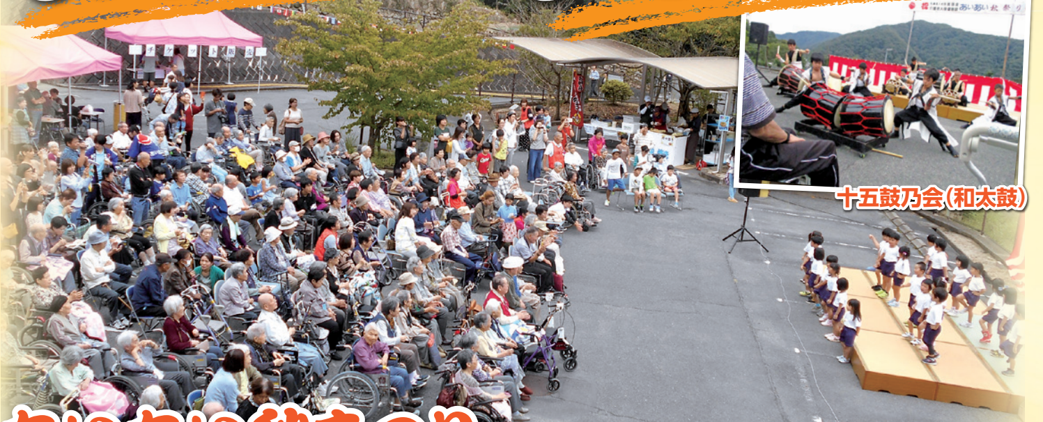
十五鼓乃会(和太鼓)