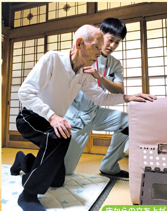
床からの立ち上がり