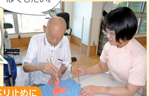
輪ゴムをつけてすべり止めに