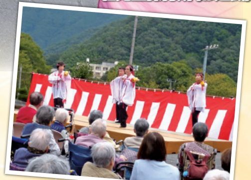
三郎丸町福寿会(踊り)