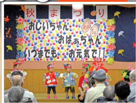
あいあい保育園(お遊戯)